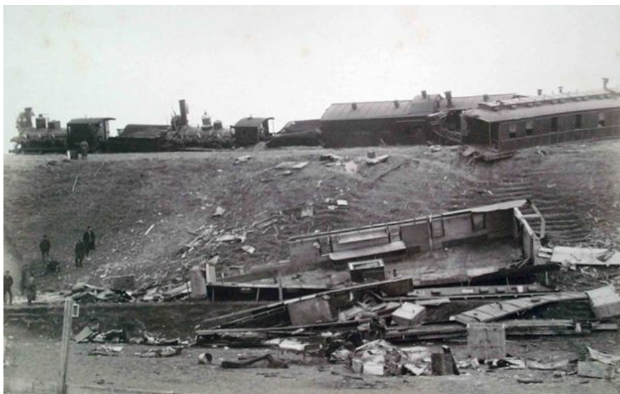
фотография А.М. Иванецкого